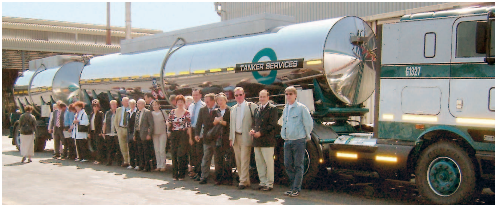
Nicht ohne Neid ließen sich die deutschen Spediteure vor den hoch modernen Tankzügen der Imperial-Logistics-Tochter „Tanker Services“ ablichten. Mit diesen Fahrzeuglängen würde man auch gern in Deutschland arbeiten.

Nicht weniger interessant waren die auf Einladung der Reederei Safmarine erfolgte Besichtigung des Containerterminals in Port Elizabeth sowie Informationen über die Probleme der Spedition in Südafrika durch die Stinnes-Tochter Schenker, die am dortigen Markt sehr erfolgreich ist. Und zu Beginn sowie zum Ende der Reise fanden fachlich spannende Gespräche über den Luftfrachtmarkt statt: am Frankfurter Flughafen mit Fraport-Managern und in Kapstadt mit Managern der South African Airways.